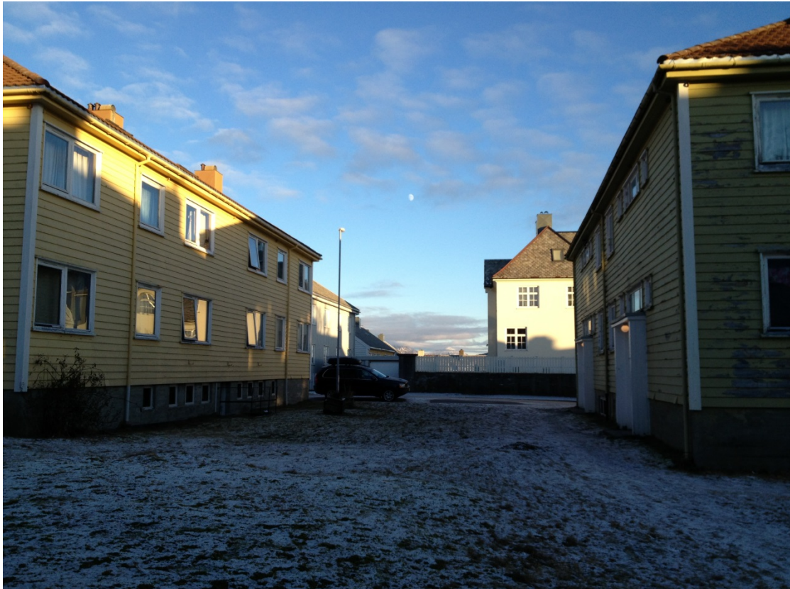
Husene i Tollåsenga

Å få til oppgraderinger med høye ambisjoner handler mye om motivasjon hos beslutningstakeren. En hovedutfordring er knyttet til organisatoriske grep, som blant annet å få beboerne med på beslutningsprosesser som innebærer tiltak for økt tilgjengelighet eller universell utforming, og kostnader/betalingsvilje på individuell basis. En viktig motivasjon ligger i tilleggskvaliteter som følger med oppgraderingen - økt komfort, nytt utseende og bedre omdømme, samt en moderne standard, som gir boligene en markant verdiøkning. Dette er alle kvaliteter som ivaretar universell utforming uten at de forbindes med funksjonshemming eller sykehjem (Nørve mfl. 2006). Økt komfort og/eller verdiøkning på boligene generelt kan være potensielle argumenter for både universell utforming og energi.