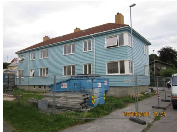
J.P. Clausens gate 25 før og etter rehabiliteringen.

En omflyttingsplan for beboerne ble satt i gang før oppstarten av det første huset, og kommunen opplever at det har gått veldig bra med omflyttingen av beboerne i dette huset. De har til og med erfart at beboerne er godt fornøyd med de alternativene de har fått utdelt, og noen ønsker seg ikke tilbake til Tollåsenga. Likevel har de et prinsipp om at de beboerne som ønsker det skal kunne flytte tilbake. Det neste korthuset står for tur til å tømmes.