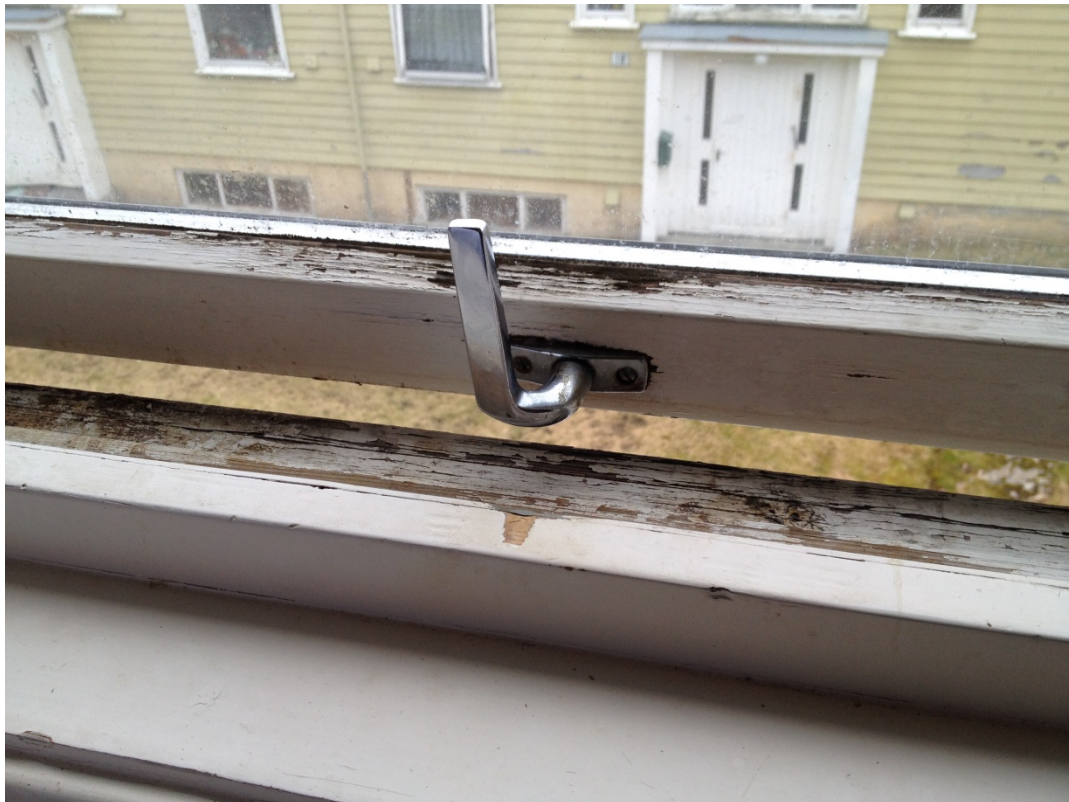
Et vindu, Tollåsenga.

En annen vi intervjuet syntes det var så kaldt i leiligheten sin at han satt med et teppe over beina mens vi var der. Det var en ovn på stua som han ikke brukte. Han brukte kun den ovnen han hadde på kjøkkenet, sa han. Dette gjorde han for å spare strøm.