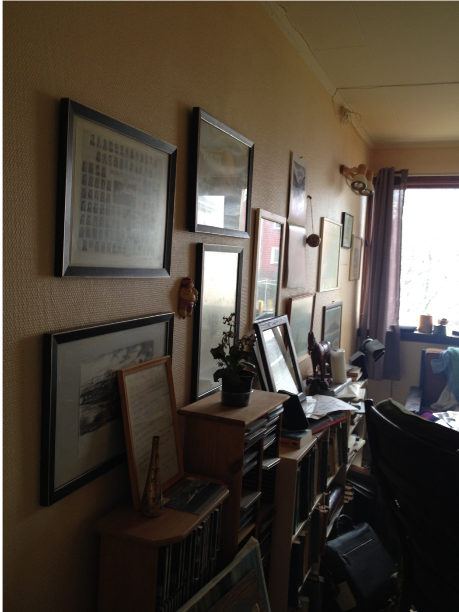
Et hjem i Tollåsenga.

Beboermedvirkning kan være tidkrevende. Sentrale aktører i byggeprosessen kan ha en tendens til å oppfatte medvirkning som en forsinkende faktor samtidig som de ofte har en annen forståelse av oppgraderingsbehovet enn beboerne. Det krever en bevissthet fra planleggerens side om dette for å unngå at det oppstår misforståelser og unødige og uventede barrierer i samarbeidet. Beboeres medvirkning er likevel sentralt og bør finne sted tidlig i prosjekter, både for å finne fram til de beste løsningene og for å unngå unødig motstand. Det er imidlertid ikke for sent å innføre beboermedvirkning i et prosjekt som allerede er påbegynt. Eksempler fra REBO viser at i de prosjektene hvor det har vært arbeidet bevisst med beboermedvirkning, er beboerne tilfredse med prosessen og med resultatene. Noen av casene viser at man må finne måter å samarbeide med beboerne på som møter deres ønsker og behov for kunnskap om prosjektet. Dette krever tid og ressurser. Når beboere har mulighet til å få kunnskap om, diskutere og innvirke på beslutningene som tas om energieffektivisering, universell