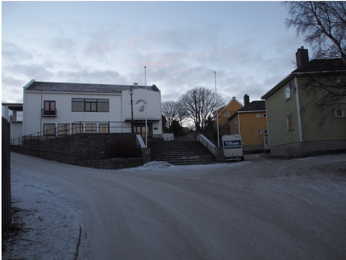
Tempohuset, Kristiansund.

tilbud til beboerne, og begynte så smått med å overflytte personell fra aktuelle enheter. I denne perioden ble treffstedet Tempokjelleren etablert ved at de overførte ressurser fra psykisk helse til å drifte dette lavterskeltilbudet.