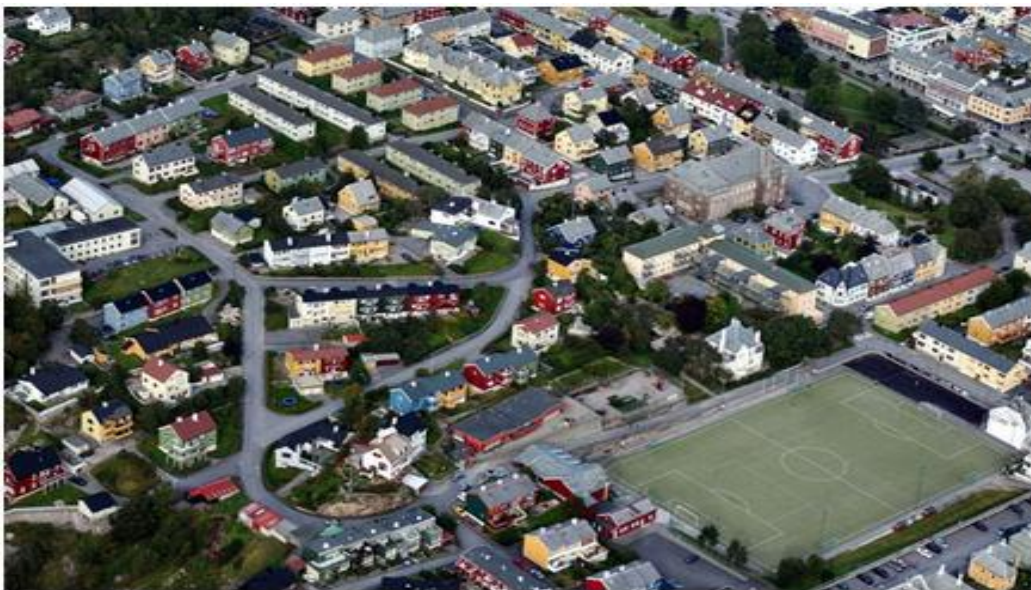
Tollåsenga, Kristiansund.

Stolt beboer er et handlingsrettet forskningsprosjekt finansiert av Husbanken som ble gjennomført av NTNU Samfunnsforskning og SINTEF Byggforsk i samarbeid med Kristiansund kommune. Stolt beboer startet høsten 2012 og ble avsluttet høsten 2014. Stolt beboer så på medvirkningsprosessene som løp parallelt med de kommunale og strukturelle prosessene knyttet til et områdeløft i det kommunale boligområdet Tollåsenga. Oppgraderingen av Tollåsenga er et stort boligsosialt utviklingsprosjekt beskrevet i «Boligsosial handlingsplan for Kristiansund kommune 2011-2014». Dette er et stort område med 104 leiligheter, og byggene og området er svært nedslitt. «Ghettoen» har vært tilnavnet, og politiutrykningene har vært mange. Kommunen ønsket en helhetlig plan for boligene i område, og ambisjonen var å endre Tollåsenga fra et «problemområde» til et levende og positivt lokalsamfunnsprosjekt. Blant annet ønsket kommunen å bygge ned fordommer i samfunnet og negativ omtale/syn på Tollåsenga og de som bodde der. Dette har vist seg som en utfordring da kommunen som eier har latt husene og området forfalle.