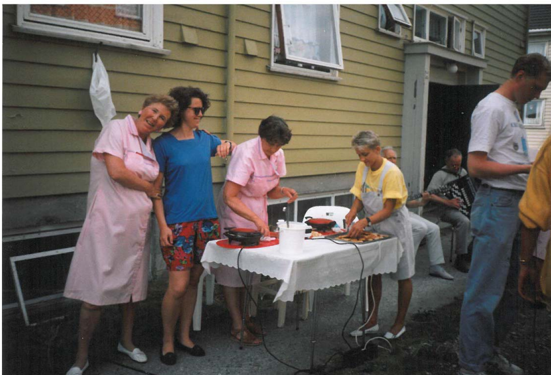
Trivsel i Tollåsenga, ca 1990.

Samtidig fortalte de om at de tidligere hadde kviet seg for å gå inn i område. Området hadde et negativt stempel og det følte utrygt der oppe. Nå har dette endret seg, mente flere, som opplever boligområdet bedre og tryggere. Men fortsatt er det bostedsløse som kommer opp i området og sover i kjellerboder og loft, noe som gjør det litt utrygt å gå på jobb der noen ganger.