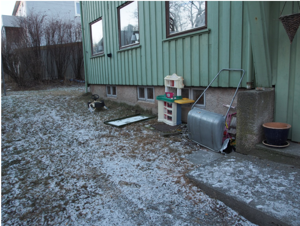
Lekene til barn i Tollåsenga.

Det beskrives litt som at det er to forskjellige «grupper» i Tollåsenga: Flyktingene og flykningfamilier holder seg for seg selv, og de andre «vanskeligstilte» holder seg for seg selv. Det kom fram at det heller ikke er mye kontakt mellom flyktingfamiliene og tjenester som Tempokjelleren og bofellesskapet. Ansatte i kommunen beskrev det som et helt greit forhold, men at det godt kunne vært mer kontakt.