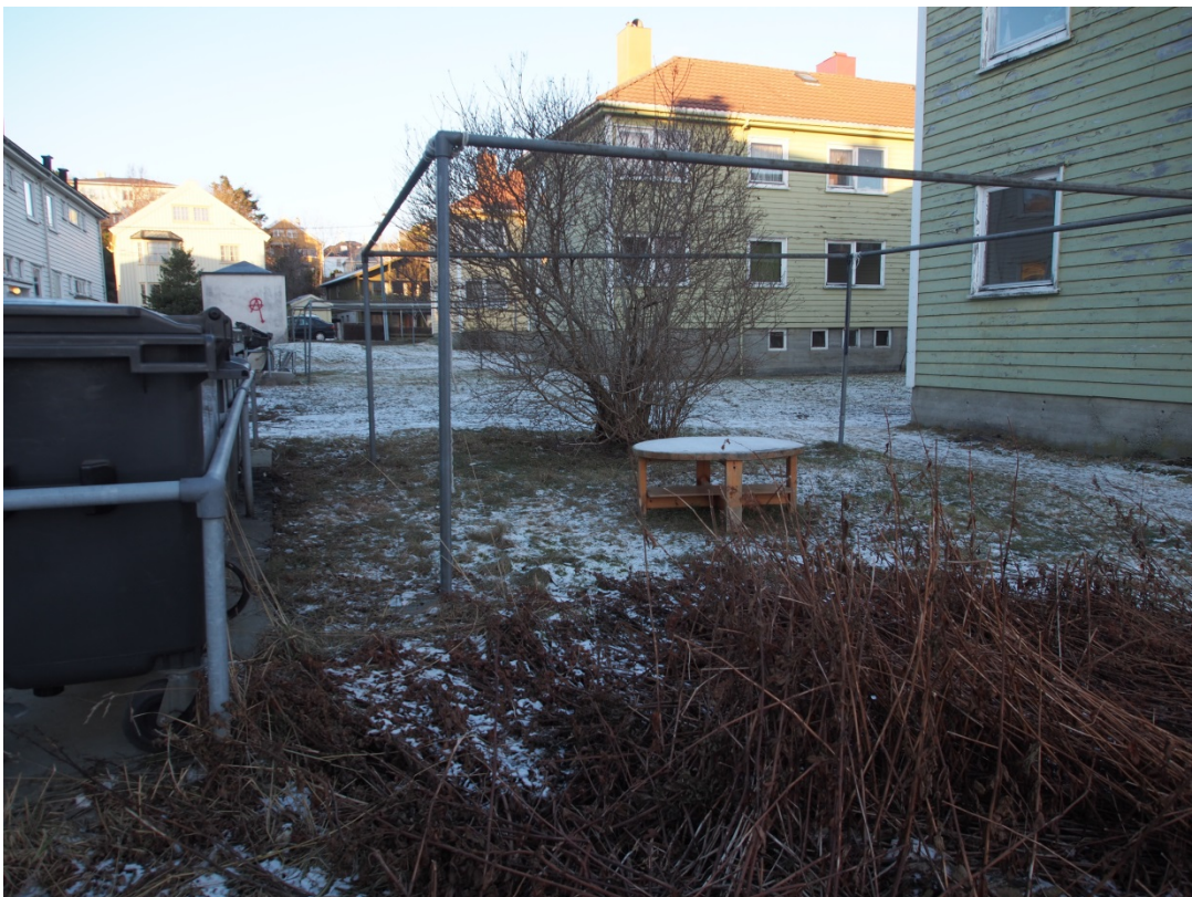
Uteområdet, Tollåsenga.

<Kristiansund kommune har planlagt at hele boligområdet skal renoveres og oppgraderes og det skal også bygges til servicearealer. Det har vært planlagt to byggetrinn. Området nord for Ivar Aasens gate utgjør første byggetrinn og består av seks to etasjes bygninger, to «langhus» og fire «korthus». Langhusene ligger med langsiden mot øst og vest og har 8 og 22 leiligheter. Korthusene ligger med langsiden mot nord og sør, tre har åtte leiligheter og en har seks leiligheter. Langhusene er planlagt ombygget til boliger med full tilgjengelighet. For de korte husene var det foreslått tilgjengelighet for rullestolbrukere i boligene i første etasje. Vurdering av energioppgradering og universell utforming er gjort for første byggetrinn. Det var disse forslag som var utgangspunkt for tiltak for energieffektivisering og universell utforming som ble foreslått i REBO.