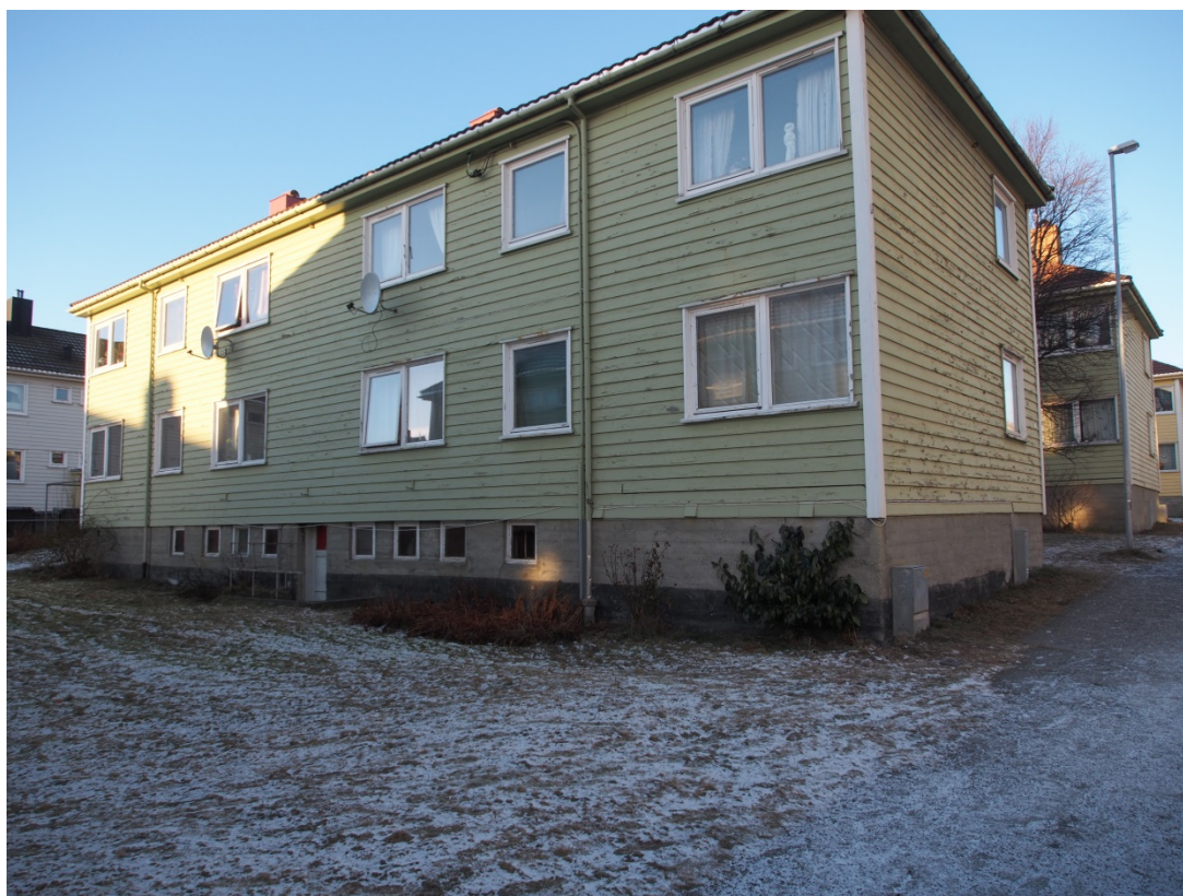
Fasadene i Tollåsenga.

Tollåsenga er et kommunalt boområde der det bor det som omtales som «vanskeligstilte på boligmarkedet». Det består av 105 leiligheter fordelt på ni toetasjes trebygninger. Området ligger sentralt i Kristiansund. Bebyggelsen er gjenreisningsarkitektur fra siste del av andre verdenskrig (1943/renovert i 1977) og er typisk for Kristiansund. Boligene og området er underlagt krav fra fylkesantikvaren om tilbakeføring til opprinnelig arkitektonisk uttrykk ved renovering/ oppgradering. Dette betyr å ta vare på den stramme fasadekomposisjonen, inngangspartiene med omramming, dørblad og bordkledning, samt tilbakeføring av den utvendige detaljeringen av hjørnestilte vindu.