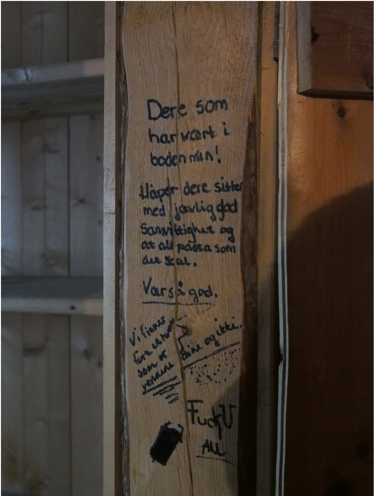
Sitat på en kjellervegg i Tollåsenga.

utfordringene knyttes til naboskap. På spørsmålet om hva de liker minst ved boligen svarte en beboer naboen, bråk hele tiden . Det er tydelig at mange opplever det som et problem, men samtidig er mange enige at godt naboskap er viktig. Dette er noe som det kan og bør jobbes med uavhengig av oppgraderingen.