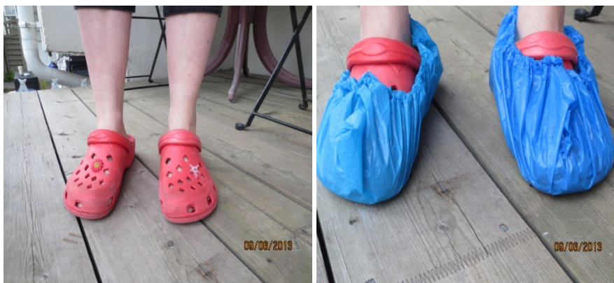
Besøk i et hjem eller hjemmebesøk?

Det er flere tjenesteutøvere innom Tollåsenga daglig, og det er beboere som mottar flere tjenester daglig. Dette er for eksempel hjemmetjenester, fysioterapi, rusomsorg eller flyktningtjenester. Noen av lavterskeltjenestene er åpne for alle beboere og med bistand fra miljøarbeidere, mens andre tjenester er basert på individuelle vedtak. Det hadde lenge vært et ønske å få en oversikt over tjenester i området for å kunne samordne disse bedre. Tollåsengaakademiet og Stolt beboer arrangerte arbeidsverksteder der alle tjenester møttes og snakket sammen om hvordan de kan fortsette å kommunisere og gi tjenester på en god måte. Noen ønsker at Tollåsenga skal utvikles til en egen samordnet enhet i kommunen, uavhengig av bydelsinndelingen som er i dag. Andre ønsker en fellesbase for alle tjenesteutøvere i området slik at tjenestene til hver person kan samordnes. I møte med brukerne av ulike sosiale og kommunale tjenester skapes det lett en «vi» og «dem» holdning. I arbeidsverkstedene ble alle oppfordret til å tenke nytt og utenfor etablerte rammer.