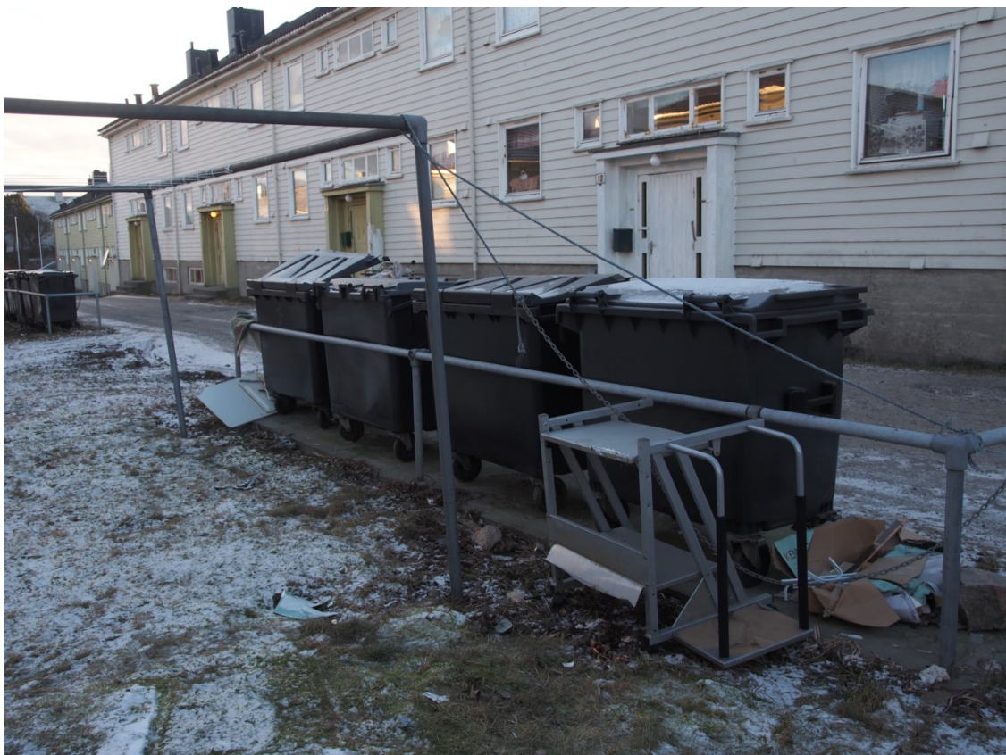
Uteområdet, Tollåsenga.

Tjenesteutøverne forteller også at de har begynt å snakke annerledes om Tollåsenga; de er bevisst hvordan de snakker om området og beboerne, og dette kan bidra til at omdømmet etter hvert endrer seg. Det er viktig at de som har ansvar for de fysiske omgivelsene kommer på banen og ser hvilke grep de kan gjøre for at det skal se bedre ut i området og oppleves tryggere for de som bor der. Utbedringer av det fysiske miljøet har vært på vent lenge, på tross av at viktige beslutninger og kommunale vedtak er fattet. Lite vedlikehold er gjort, antageligvis fordi man venter på en renovering. Ventetida har stadig blitt forlenget og bidratt til frustrasjoner blant beboerne. Situasjonen er ikke blitt bedre av at ønsket fra beboermiljøet om å få midler til å gjennomføre små tiltak ikke nådde fram. Dersom en lar det forfalle fordi en tenker at «beboerne tar seg ikke av det uansett», har man gitt opp å skape forandring. En kan snu det på hodet og si at manglende vedlikehold og standard reflekterer kommunens holdning til området og at huseier «lar det forfalle». Små grep med små midler kan få beboere til å ønske å skape det finere rundt seg. Mange har sagt seg villige til å delta på dugnad eller jobbe (med litt lønn) med beplantning og maling av husene i området.