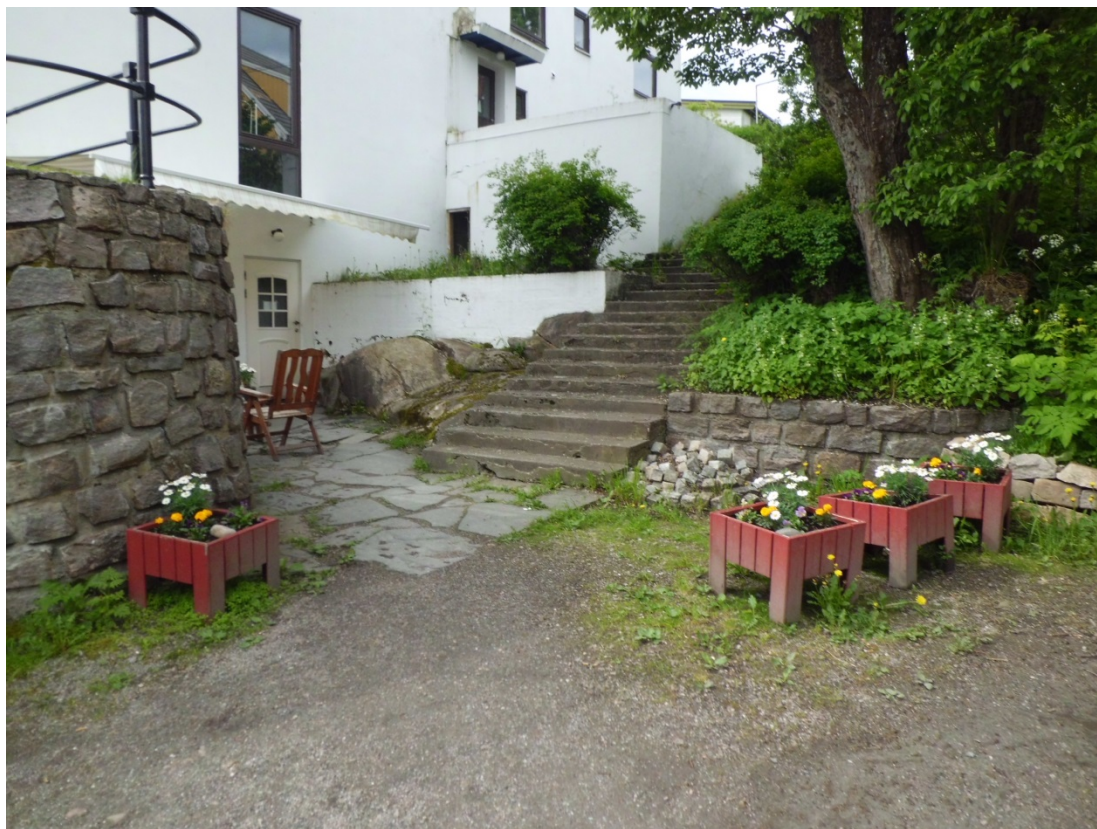
Inngangsområdet til Tempokjelleren.

Et annet problem som påvirker trivsel er at såpass mange ikke synes det er greit å ta i mot besøk. Halvparten av beboer svarte at det var greit å ta i mot besøk, mens en tredel mente det ikke var greit å ta i mot besøk i leiligheten sin. Det er ulike grunner for det. Noen mente det er for mye bråk, mens andre sa det er fordi det ikke ser ut i Tollåsenga . En annen beboer ønsket ikke besøk fordi han hadde opplevd tyveri. Det er noen beboere som mener boligen er for liten til å ta i mot gjester og det er noen som ikke vil ha besøk. I intervjuene kom det imidlertid fram andre aspekter, der folk fortalte at de tok i mot barnebarn på besøk og i familieleilighetene er det barn som ofte har venner på besøk. Det er en sammensatt beboergruppe og dette påvirker hvordan de bor sammen og hvem de omgås med.