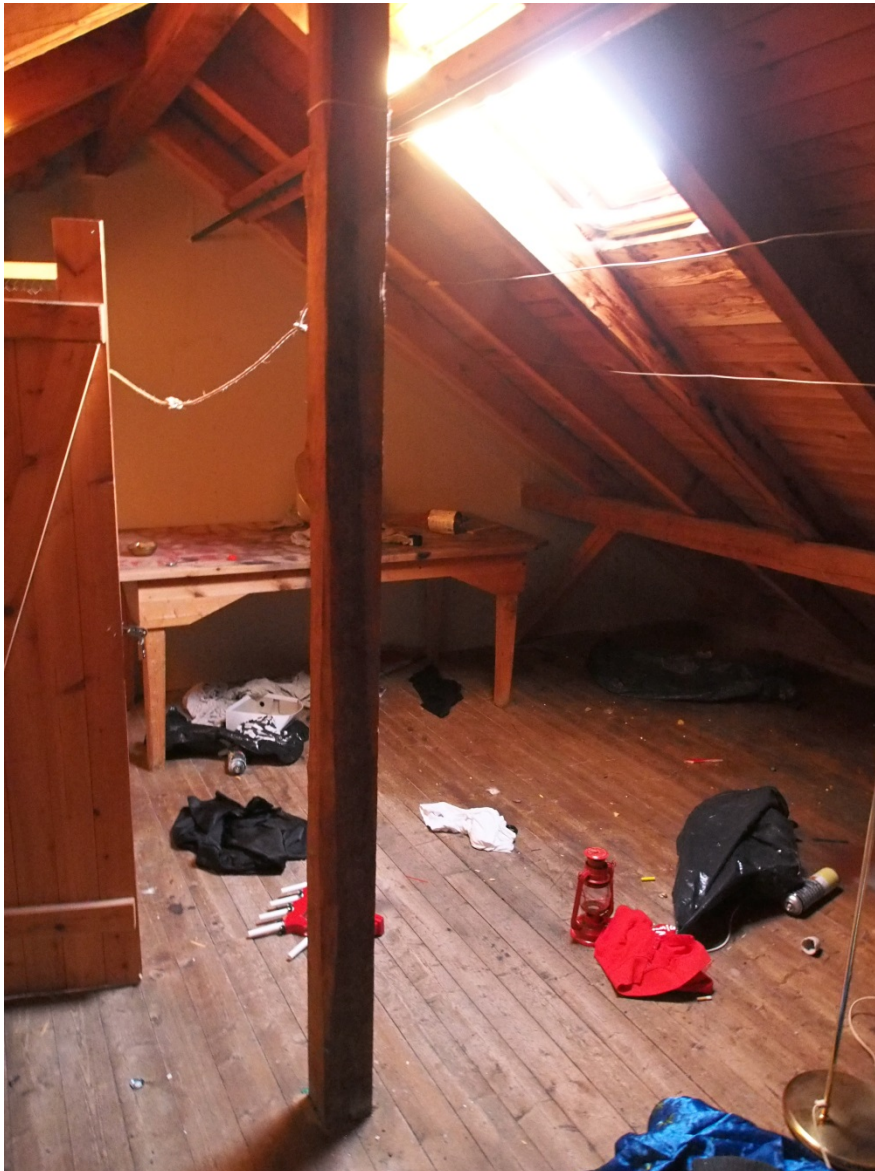
Et loft, Tollåsenga.

utfordringer i forhold til plassmangel og luft, men vil også kunne skape mer trygghet i forhold til tyveri av klær og uhygieniske forhold 3 .