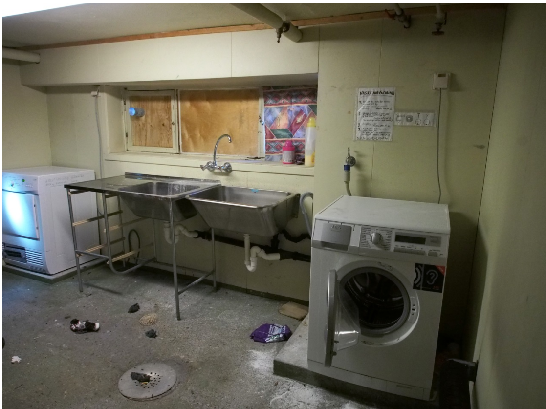
En vaskekjeller, Tollåsenga.

Det er flere aspekter ved boligene som krever utbedring: Forholdet mellom boligens størrelse og oppbevaringsplasser, innklimaet og strømforbruket bør undersøkes nærmere. De fleste boligene i Tollåsenga er små ett- til toroms leiligheter. Flere av beboerne som bor i ett-roms klager over plassmangel, men beboerne har ulike behov. En beboer som skal bo kort i Tollåsenga trenger kanskje ikke mye lager- eller skapplass, mens de som bor der i flere år vil sannsynligvis ha flere ting som skal lagres. I spørreundersøkelsen svarte over halvparten at de ikke brukte kjellerbodene. Forklaringen var hovedsakelig at det var for mange innbrudd i kjeller- og loftsboder. En beboer påpekte at stjeling av klær fra vaskekjeller og stjeling fra loft og kjeller skaper utrygghet . Samtidig var det ti personer som fortalte at de brukte kjellerbodene. I intervjuene forteller en beboer at han har tatt i bruk bodene igjen: Jeg bruker bodene på loftet og i kjelleren. Har ikke folk her som stjeler lenger .