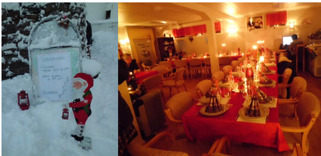
Jul i Tempokjelleren.

Det har skjedd noe med omdømmet til Tollåsenga de siste årene. Fra å bli beskrevet som en «ghetto» er det flere som bruker navnet Tollåsenga og det er forventinger knyttet til oppgraderingen. Beboere deltar sosialt hvis det skjer noe, og de bruker sine stemmer i ulike fora og i sammenhenger der de kan bli hørt. Flyktningfamilier fortalte om den koselige julefesten i Tempobygget der barna i området optrådte, og om sommerfesten med langbord mellom husene. Mange viser engasjert for sitt eget boligområde. Mange av beboerne sliter med flere utfordringer, og de hverdagslivene som leves av noen kan bli på bekostning av andres trygghet og ro. Samtidig er det viktig å ha fokus på å fjerne