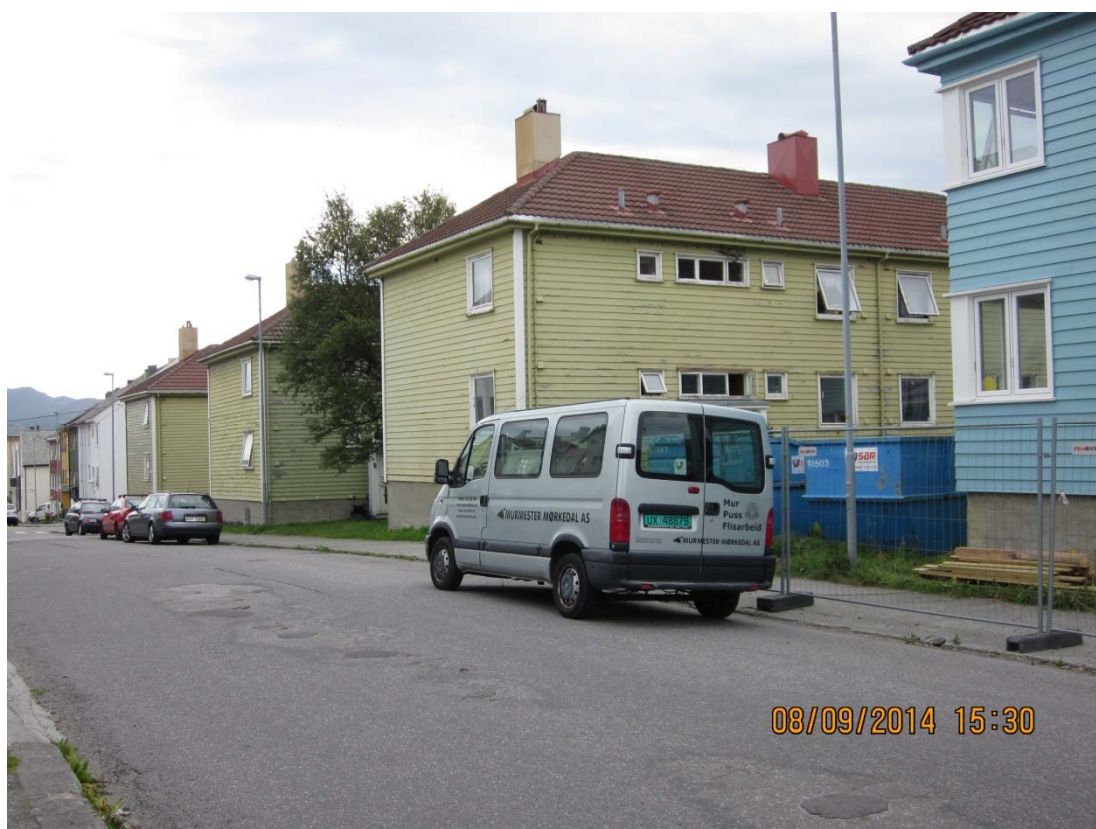
De fire korthusene i J.P. Clausens gate og det rehabiliterte huset med "tilbakeført" hjørnevindu til høyre.

Prosjektet «Stolt beboer» har fulgt arbeidet med å oppgradere Tollåsenga siden høsten 2012. I løpet av denne perioden har det vært både oppturer og nedturer. Arbeidet med å utbedre husene har vært forsinket, og beboerne har i perioder vært både utålmodige og desillusjonerte. Samtidig har vi sett at både beboere og tjenesteutøvere har greid å finne positive «venteaktiviteter» og gjennom dette greid å holde motet oppe. Det er skapt sosiale møteplasser, og det er gjort grep for å få til bedre samarbeid og samordning av det kommunale tjenestetilbudet i området. Nå er oppgraderingen av det første huset godt i gang, noe som er med på å skape ny optimisme i området.