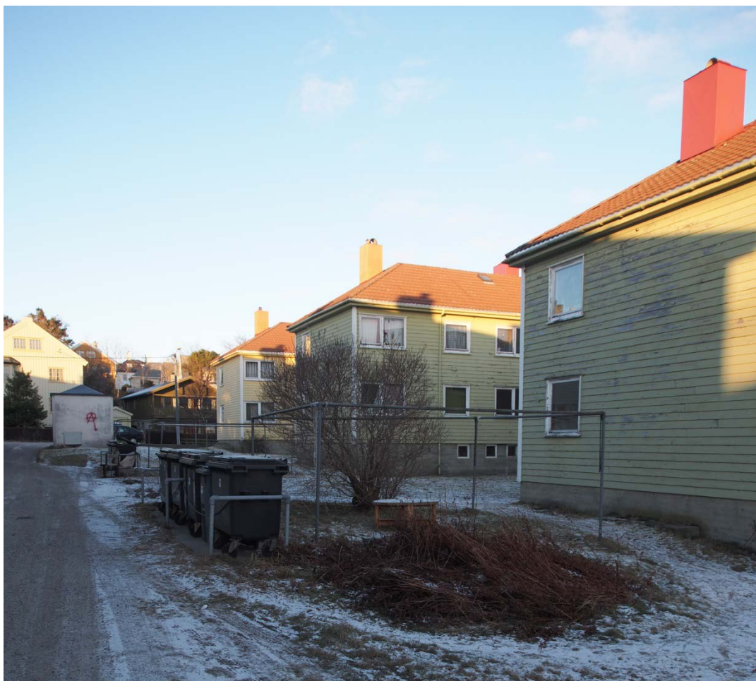
Uteområdet, Tollåsenga.

De fysiske omgivelsene mennesker omgir seg med har betydning for hvordan du har det. Det kan bidra til stolthet, men det kan også bidra til det motsatte. Ofte er det detaljer i en planløsning eller konsept som bidrar til trivsel og funksjonalitet for den gitte brukergruppen. For å oppnå dette er det viktig at innsikt i brukergruppers behov på et konkret nivå kommer inn tidlig nok i prosjektet. Av erfaring er dette en av nøklene til suksess i et prosjekt. Mål for kommunens arbeid har vært å bidra til å bygge ned fordommer i samfunnet og negativ omtale/syn i Tollåsenga og de som bor der. Dette kan bare oppnås gjennom en tverrfaglig og helhetlig tilnærming, hvor små grep på ulike felt kan bidra til en forbedring. For å oppnå ønsket resultat var det viktig at det ble jobbet parallelt med å utvikle tjenestesiden og med på å utvikle de fysiske omgivelsene.