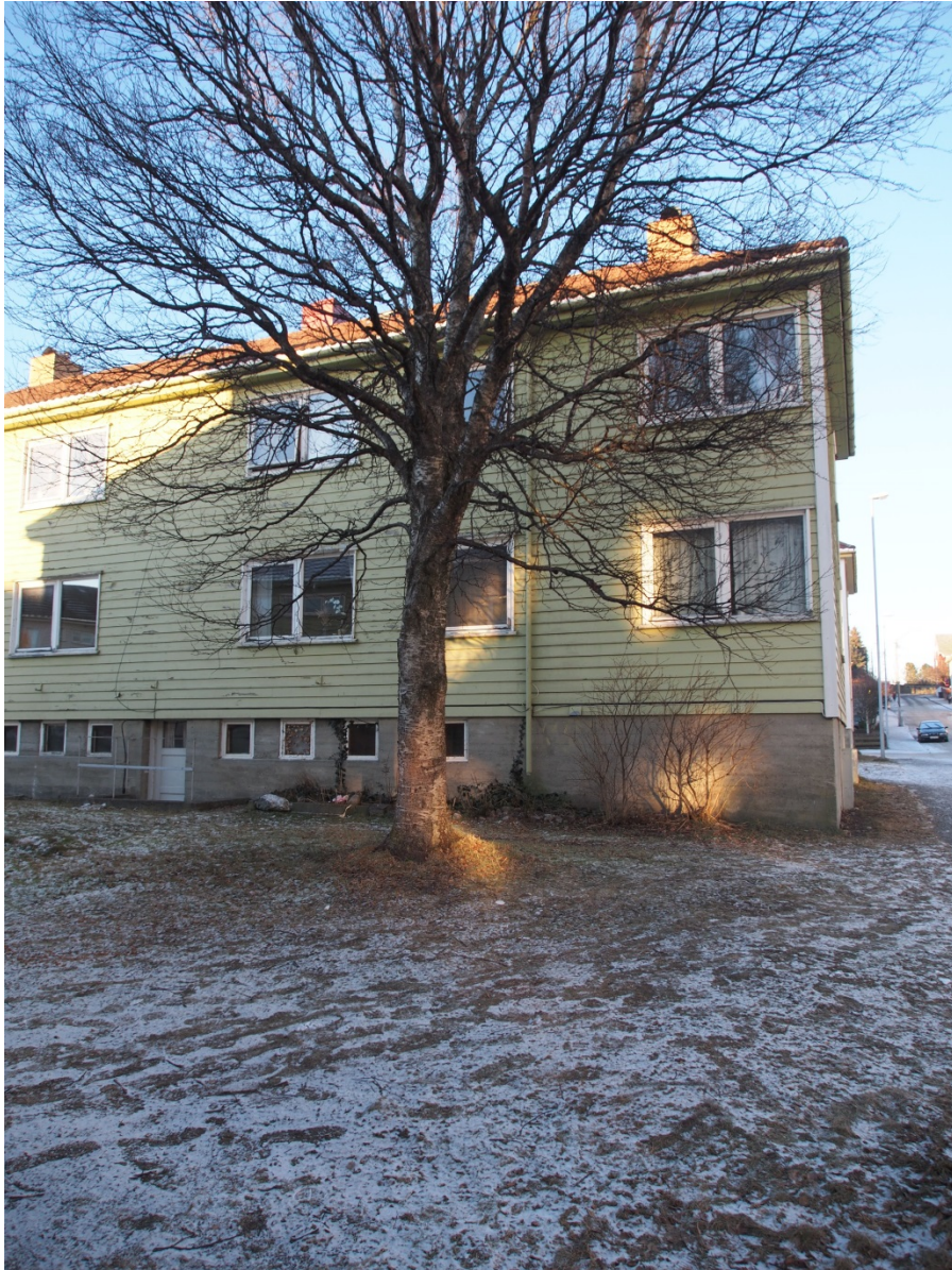
Uteområdet, Tollåsenga.

En bolig er mer enn bare et funksjonelt sted. En bolig er både en fysisk struktur som tilbyr beskyttelse til personer og eiendeler, og det er et hjem som er skapt av menneskelig aktivitet som foregår i og rundt den fysiske strukturen. Valg av bolig knyttes stadig mer til valg av livsstil , og det å skaffe seg en bolig er ofte ikke forstått som et sluttresultat i seg selv, men heller en måte å oppnå et sluttresultat på (Clapham 2005). Vi viser hvem vi er og hvor vi står i verden gjennom boligene våre. Beboerne i Tollåsenga har nøkterne forventninger til egen bolig. En beboer formulerte det slik: Jeg trives men jeg håper at standarden skal oppgraderes. En menneskeligverdig standard . Men likevel påvirker de og er påvirket av boligen de bor i, og beboerne vet at det finnes forskjellige holdninger til Tollåsenga som sted. En beboer som vi intervjuet sa: Tollåsenga er følelser. Det har en frynsete rykte i Kristiansund. Men rykte er bare rykte . En annen beboer var av en annen oppfatning: