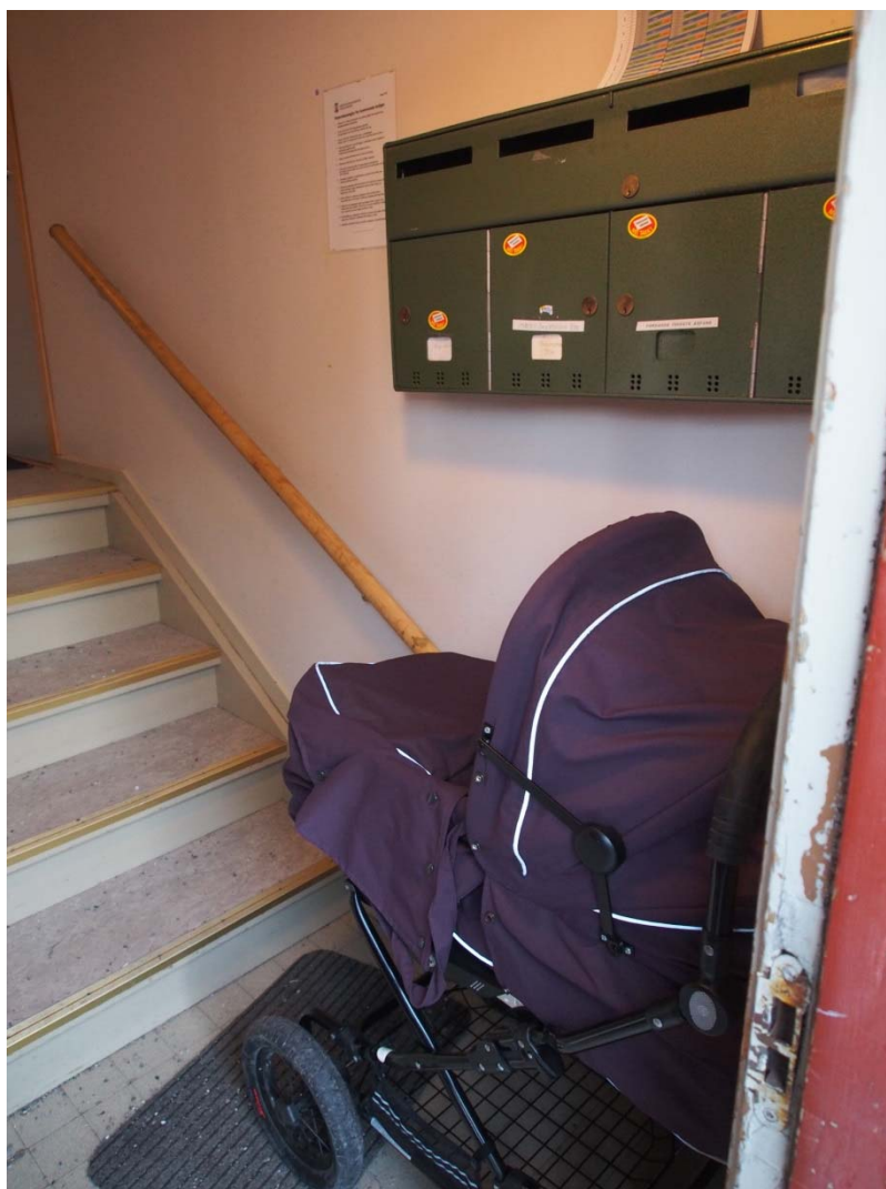
Inngangsområdet, Tollåsenga.

I boligsosial handlingsplan for Kristiansund står det at de ønsker å skape grunnlag for at ulike vanskeligstilte brukere kan få et nytt tilpasset botilbud og bomiljø . Det står samtidig at prosjektet kan ha en overføringsverdi til andre, tilsvarende boområder: Veien fra «problemområde» til levende og positivt lokalsamfunnsprosjekt .