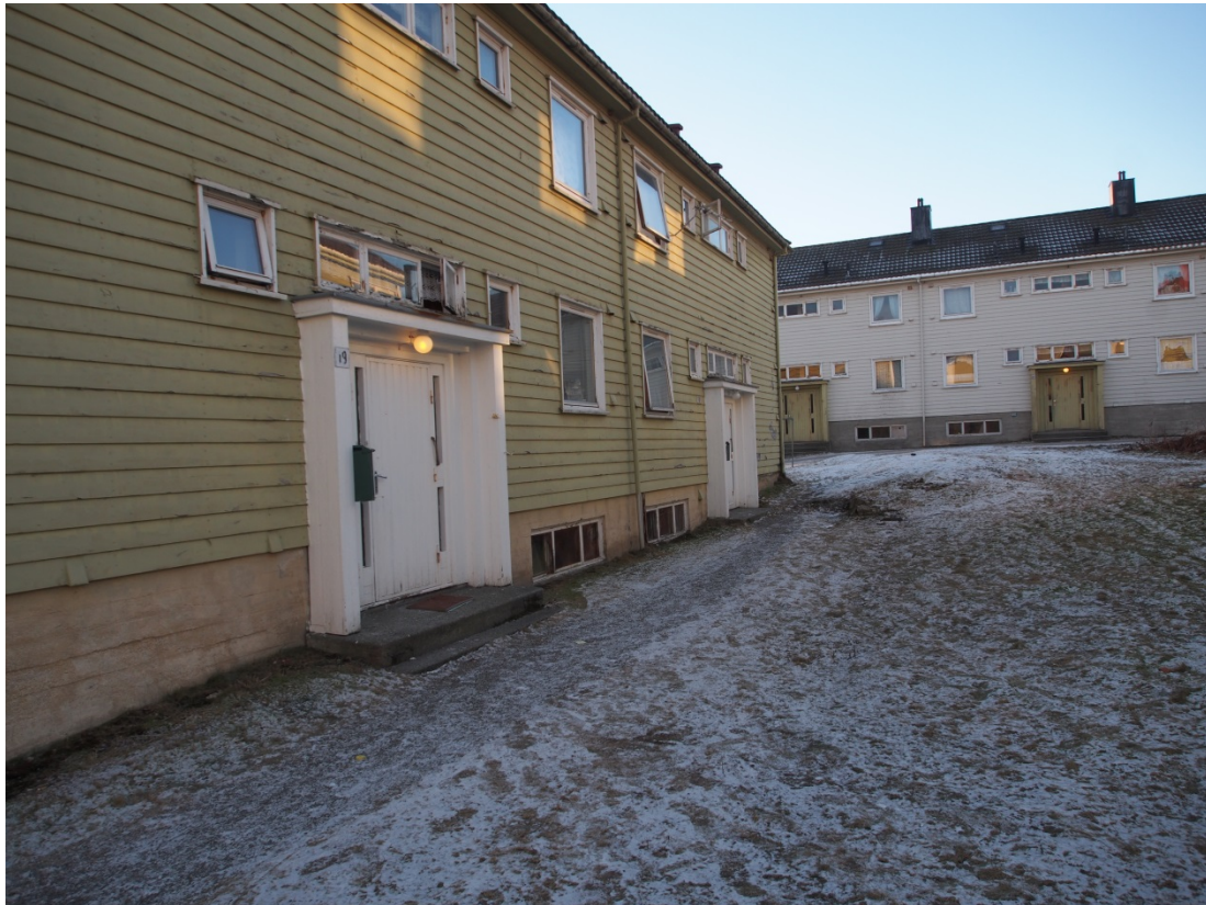
Fasader og inngangspartier, Tollåsenga.

gjennomføring. To nivå for energioppgradering ble utarbeidet, og resultatene av energiberegningene viste at energibehovet reduseres med 60 prosent fra dagens tilstand til dagens krav og med 70 prosent til passivhusnivå. Energistrategien viste at det var mulig å oppnå passivhusnivå for Tollåsenga uten at merkostnadene ble betydelig høyere (Lien mfl. 2013).