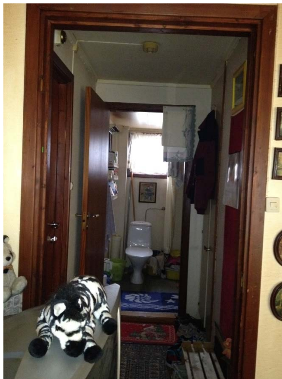
To interiør fra Tollåsenga.