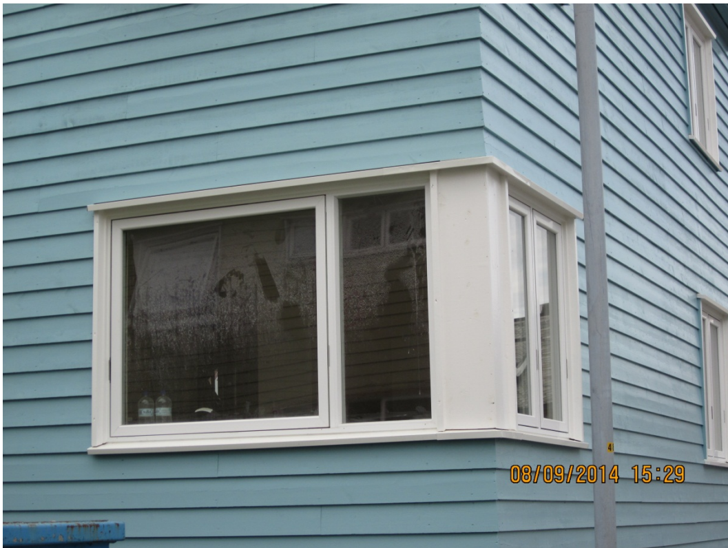
«Tilbakeført» hjørnevindu i J.P. Clausens gate 25.

derimot på sørområdet med nye øyne mens arbeidet med nordområdet gjennomføres. I dag har nordområdet om lag 64 boenheter, og sørområdet har om lag 35 boenheter.